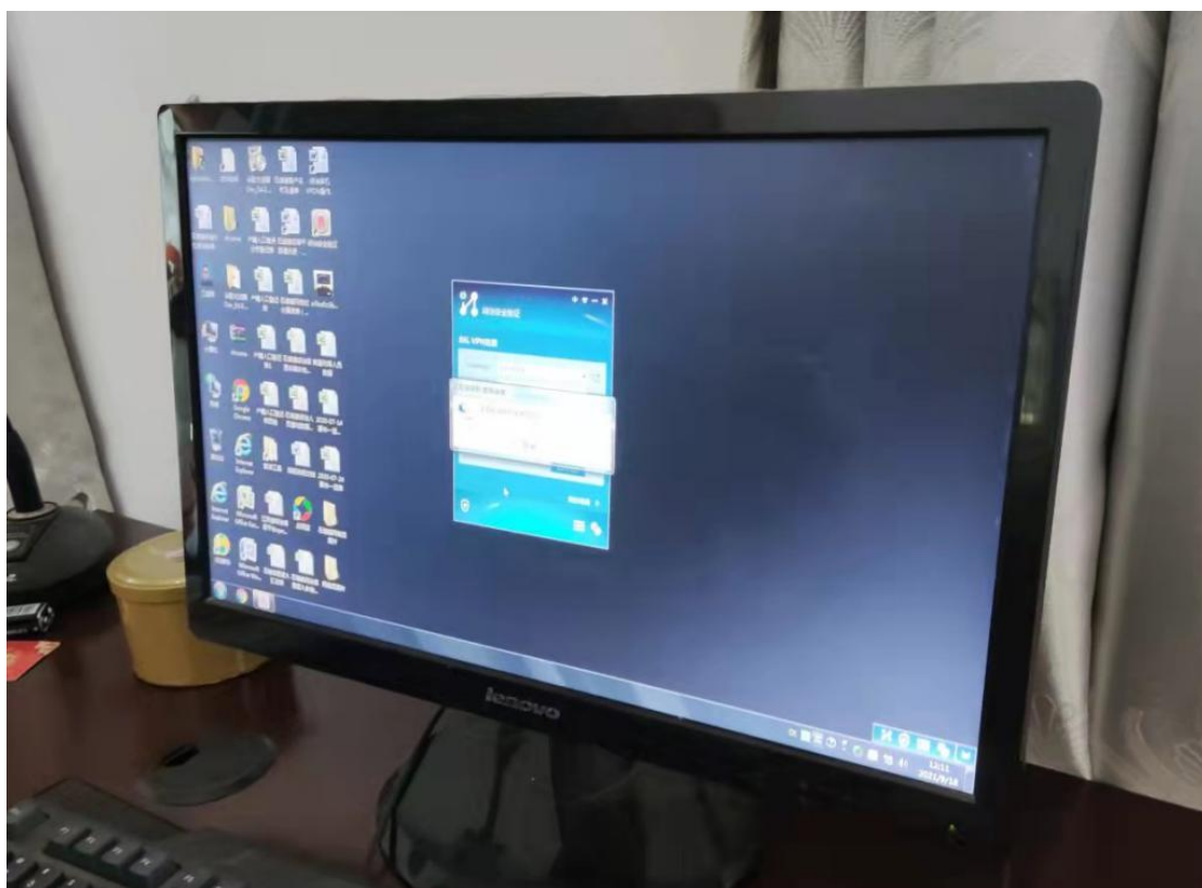
图 3 新建区石埠镇石埠村无法登陆信息系统